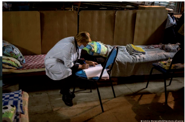
Підвал лікарні у Кисві, де лежать роділлі